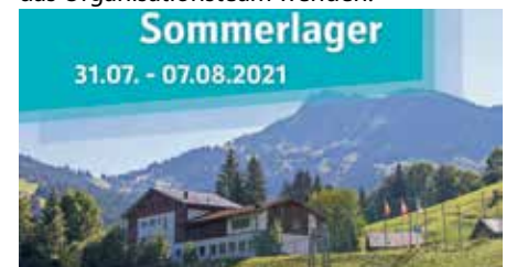
Das Ferienheim Gastlosen in Jaun (CH).

Du kannst dich bei Fragen auch gerne unter der Mailadresse sola@kjg-muellheim.de an das Organisationssteam wenden.