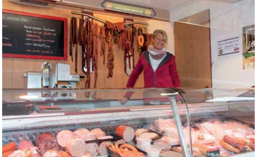
Die Metzgerei Durst kommt jeden Dienstag und Samstag zum Müllheimer Wochenmarkt.

D er Müllheimer Wochenmarkt bringt nicht nur Leben in die Fußgängerzone im Bereich des Marktplatzes, er versorgt auch viele Menschen in der Stadt mit frischen Lebensmitteln und Blumen. Aktuell sind 27 Marktbesucher aus der Region vertreten. Doch nicht alle Erzeuger und Erzeugerinnen sind an allen drei Markttagen in Müllheim. Manche bieten ihre Erzeugnisse nur dienstags an, andere Marktbesucher wählen einen der beiden anderen Markttage, manche Anbieter kommen an allen drei Markttagen, also dienstags, freitags und samstags. Die gebotene Vielfalt braucht keinen Vergleich mit anderen Wochenmärkten in der Region scheuen. Wer bei den Marktleuten einkauft, schätzt vor allen Dingen die Frische der Produkte und die Vielfalt. In einer losen Reihenfolge stellt die Stadtverwaltung die einzelnen Marktbesucher vor.