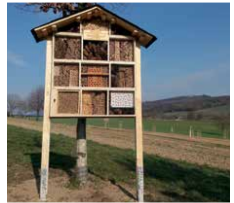
mit Blick auf die L 125

An dieser Stelle unser herzlicher Dank an die vielen Menschen, die zum Gelingen dieses umweltfreundlichen Projekts beigetragen haben.