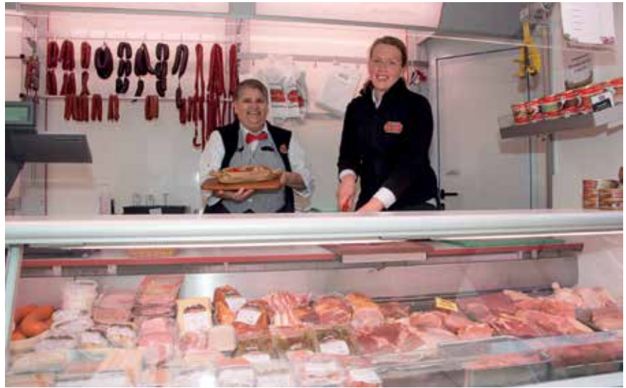
Die Metzgerei Dosenbach kommt jeden Freitag und Samstag zum Müllheimer Wochenmarkt.

Der Müllheimer Wochenmarkt bringt nicht nur Leben in die Fußgängerzone im Bereich des Marktplatzes, er versorgt auch viele Menschen in der Stadt mit frischen Lebensmitteln und Blumen. Aktuell sind 27 Marktbesucher aus der Region vertreten. Doch nicht alle Erzeuger und Erzeugerinnen sind an allen drei Markttagen in Müllheim. Manche bieten ihre Erzeugnisse nur dienstags an, andere Marktbesucher wählen einen der beiden anderen Markttag, manche Anbieter kommen an allen drei Markttagen, also dienstags, freitags und samstags. Die gebotene Vielfalt braucht keinen Vergleich mit anderen Wochenmärkten in der Region scheuen. Wer bei den Marktleuten einkauft, schätzt vor allen Dingen die Frische der Produkte und die Vielfalt. In einer losen Reihenfolge stellt die Stadtverwaltung die einzelnen Marktbesucher vor.