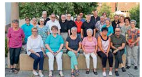
Dies ist ein Bild aus dem Jahr 2019

Mit freundlichen Sängergrißen Ihr Gesangverein Dattingen