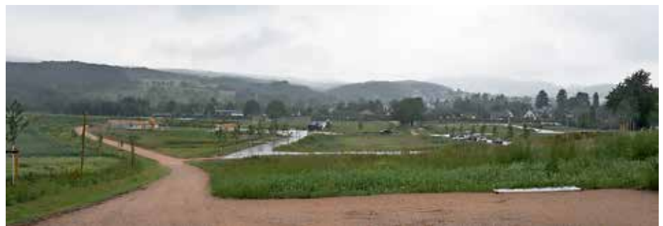
Bild 1: Mit dem symbolischen Durchschneiden eines Bandes in Müllheimer Farben fiel der offizielle Startschuss für die Bebauung im Gebiet „Am langen Rain“.