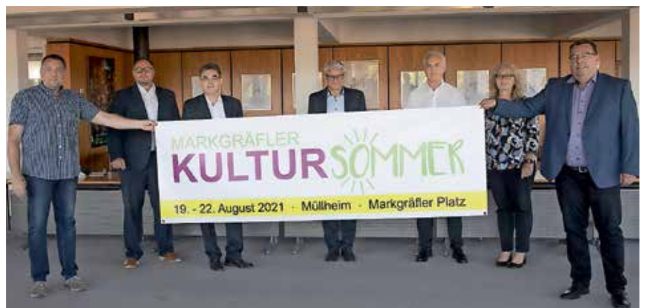
Startschuss für den Markgräfler Kultursommer, der von der Eventagentur Karo Events gemeinsam mit der Stadt Müllheim und den Sponsoren auf die Beine gestellt wurde.

Einlass ist übrigens um 19 Uhr. Beim Bestellvorgang, das ausschließlich online stattfinden wird, gibt es personalisierte Tickets. „Wir haben alles unter den geltenden Hygienevorschriften organisiert“, verweist Römmler auf zahlreiche Details wie Sitzgelegenheiten, Eingänge und dezentrales Catering. Der Vorverkauf läuft bereits über die Portale Reservix.de, karoevents.de, bei den BZ-Geschäftsstellen und bei der Müllheimer Tourist-Info.