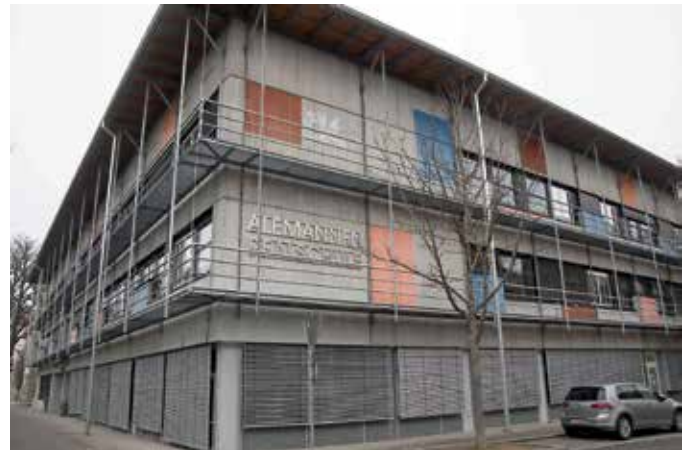
Die Generalsanierung der Alemannen-Realschule soll im Juli losgehen.

Der Gemeinderat beauftragt das Projektsteuerungsunternehmen Drees & Sommer / Niederlassung Freiburg mit der Projektsteuerung der Stufe 4 (Ausführung) und der Stufe 5 (Projektabschluss) im Zeitraum der gesamten Bauzeit an der Alemannen-Realschule (Beginn Juli 2021 bis Ende ca. Herbst 2025) zum Angebotspreis von 342.357,94€ brutto.