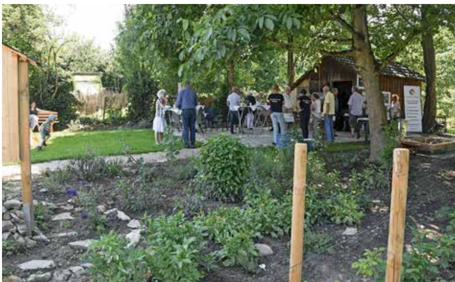
Der neue Generationengarten am Warmbach hat sich toll entwickelt: Das generationenübergreifende Projekt wurde nun mit einem kleinen Fest offiziell der Öffentlichkeit vorgestellt.