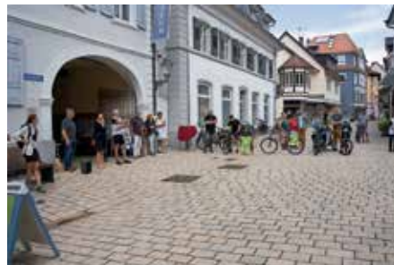
Der Startschuss für den STADTRADELN-Wettbewerb ist gefallen.

https://www.muellheim.de/stadtentwicklung-wirtschaftsfoerderung/stadtradeln/ https://www.stadtradeln.de/muellheim