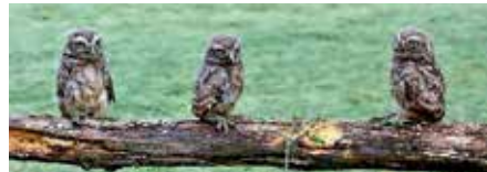
Steinkäuse bei der Beringung

wurden leider abgebrochen. Es gab aber eine erfolgreiche Zweitbrut, bei der allerdings nur 1 Nestling beringt werden konnte. Die Steinkäuse sind da, und wir hoffen auf mehr Bruterfolg im kommenden Jahr. Die Zusammenarbeit mit der Stadtverwaltung funktioniert bestens, und dank der ständigen Unterstützung durch die NABU-Helfer kann dieses Projekt weiterhin erfolgreich fortgesetzt werden.