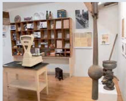
Einen Überblick über Entwicklungen und Ereignisse zeigt der erste Teil der Ausstellung im Dachgeschoss.