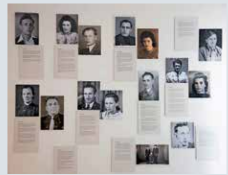
Über die Schicksale der Zwangsarbeiter und den beigesetzten polnischen Kindern auf dem sogenannten „Polenfeld“ auf dem alten Friedhof berichtet der dritte Teil der Ausstellung.