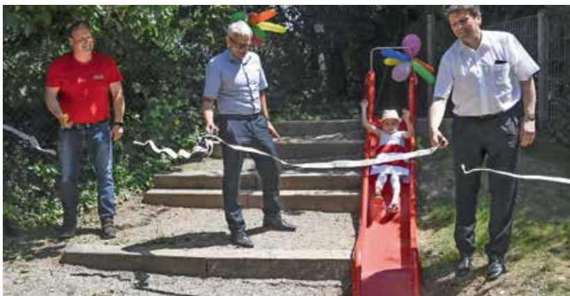
Bei einer kleinen Feierstunde wurde die neue Rutsche im evangelischen Kindergarten Käppelematten eingeweiht.

Im Wert von mehr als 2.500 Euro wurde kürzlich dem evangelischen Kindergarten Käppelematten ein neues Sonnensegel und eine Rutsche vom Heizungstechnikspezialisten ELCO gespendet. Initiiert hat das ein Kindergartenvater, der von einem Spendenprogramm seines Arbeitgebers erfahren hatte.