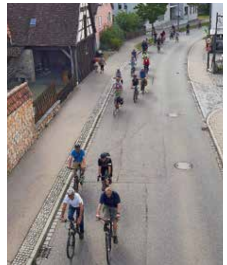
Müllheimer radeln fleißig beim Wettbewerb „Stadtradeln 2021“

Parallel zum Stadtradeln nimmt die Stadt Müllheim an der kommunalen Klimawette teil, die durch die AGUS organisiert und für die im Mitteilungsblatt ebenfalls geworben wurde.