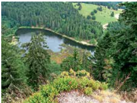
Nonnenmattweiher vom Weiherfelsen

Eine Anmeldung ist nicht erforderlich. Der Eintritt ist frei, um eine Spende wird gebeten.