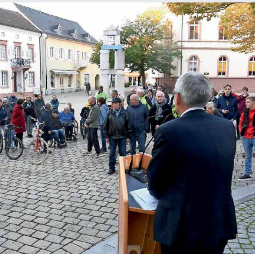
Fast 100.000 Kilometer brachten die beim STADTRADELN Wettbewerb registrierten Teilnehmenden zusammen.