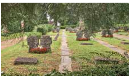
Polenfeld auf dem alten Friedhof