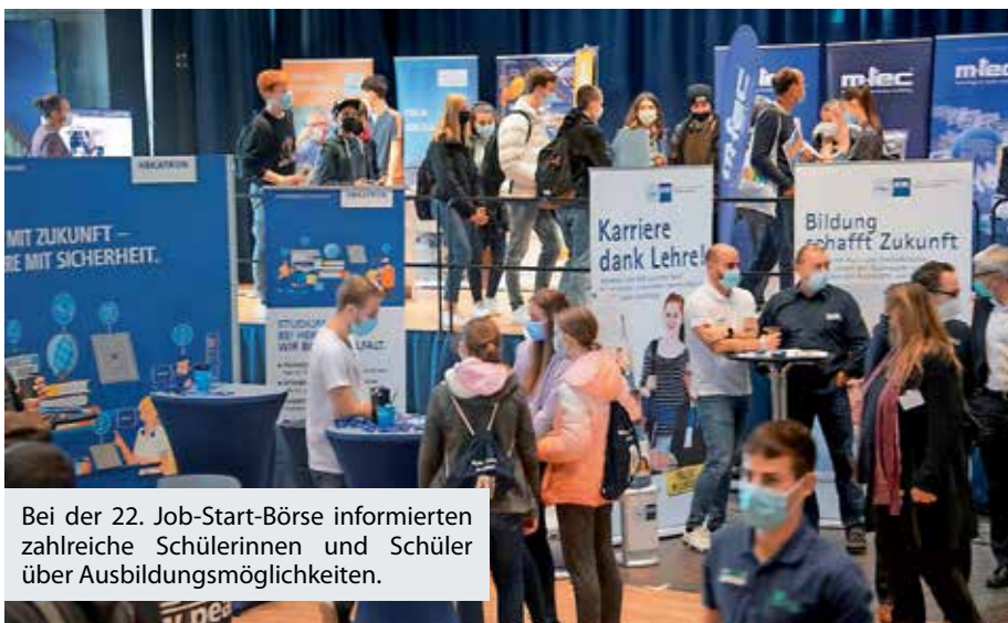
Bei der 22. Job-Start-Börse informierten zahlreiche Schülerinnen und Schüler über Ausbildungsmöglichkeiten.

Bis Mitte November können sich Interessierte Jugendliche und deren Eltern auch bei der virtuellen Messe im Internet informieren. Dort gibt es ergänzende Angebote, Infos zu den Unternehmen, ein Bewerbertraining, wie auch ein Berufstest, bei dem die Schüler entsprechend ihrer Neigungen geeignete Ausbildungsberufe vorgeschlagen werden.