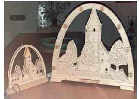
Martinskirch als kleiner und großer Schwibbogen

Der Förderverein zur Pflege der Städtepartnerschaft mit Vevey in der Schweiz wird vom 27. November bis zum 18. Dezember an jedem Samstag in der Wilhelmstraße, vor dem Marktbereich, einen Infostand haben. An dem Infostand wird der kleine und große Schwibbogen mit dem Motiv der Martinskirche verkauft. Es ist nicht nur ein schönes Geschenk zur Weihnachtszeit, sondern dient auch der Förderung von verschiedenen Projekten im Rahmen der Partnerschaft mit der Stadt Vevey in der Schweiz am Genfer See. Der Förderverein freut sich auf viele Interessenten und Käufer der Schwibbögen. Die Schwibbögen kann man auch bei der Touristikinformation und bei Hitschler in der Hauptstr. 6 erwerben.