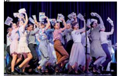
Musik für den Frieden

Informationen zum Verein, den Projekten und dem „Ensemble MIR“ findet man auf der Homepage: www.musik-fuer-den-frieden.de