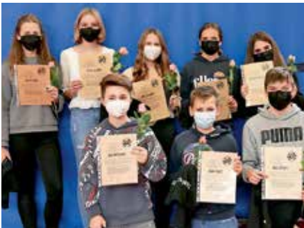
Die neu ernannten Schülerschlichter*innen an der ARS.

Die Schulgemeinschaft wünscht den 8er-Schlichtern einen guten Start und dankt den 10er-Schlichtern für ihre tolle Schlichterarbeit.