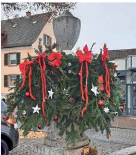
Weihnachtsschmuck am Löfflerbrunnen