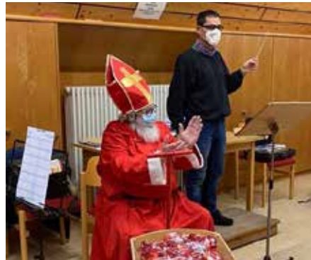
Applaus vom Nikolaus für die Musizierenden

Die Stadtmusik wünscht allen ein frohes Weihnachtsfest und alles Gute und Gesundheit im Neuen Jahr!