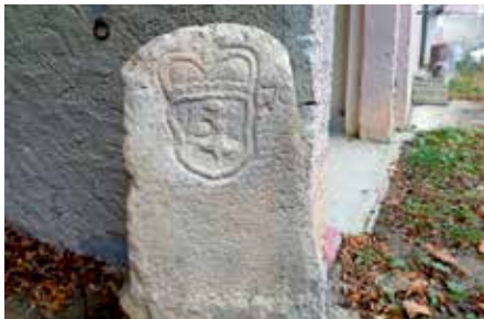
Dieser Grenzstein wird vermisst.

Die Ortsverwaltung Feldberg vermisst einen alten Grenzstein, der auf dem Bauhof Feldberg gelagert war. Wer Hinweise zum Verbleib des Steines geben kann, soll sich bitte beim Ortsvorsteher Schwald oder in der Ortsverwaltung melden!