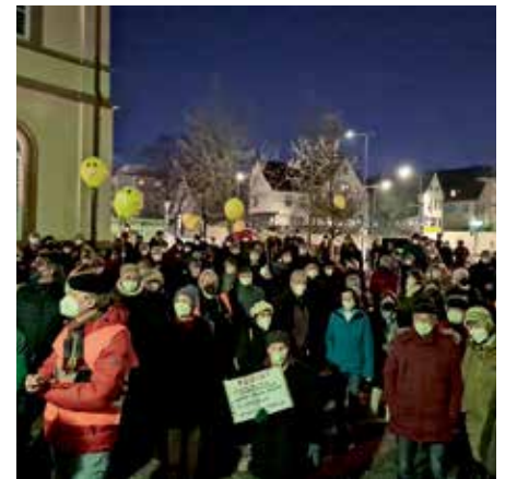
Gegendemonstration am 7.2. am Markgräfer Platz

Die nächste überparteiliche Gegendemonstration wird am 21. Februar an der Martinskirche stattfinden und es werden auch wieder kleine Reden gehalten. Unser Bundestagsabgeordneter, Takis Mehmet Ali, wird auch dabei sein und eine kleine Rede halten.