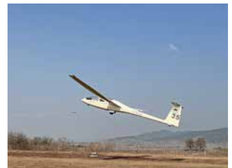
Der zweisitziger Segler vom Typ DG 500 kurz nach dem Abheben im Windenstart.