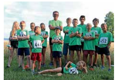
Kinderlauftreff Britzingen beim Biengener Mitternachtslauf 2022