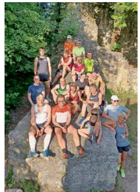
Finisher Neuenfelslauf 2022

.....aber danach gehts für alle in die wohlverdiente Sommer- und Regenerationspause.