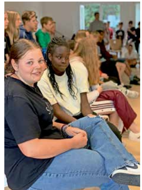
Gottesdienst der Realschule zum Schuljahresende

Wir wünschen Ihnen und Ihren Kindern erholsame Sommerferien und freuen uns gemeinsam im September hoffnungsvoll in das neue Schuljahr 2023/24 starten zu dürfen.