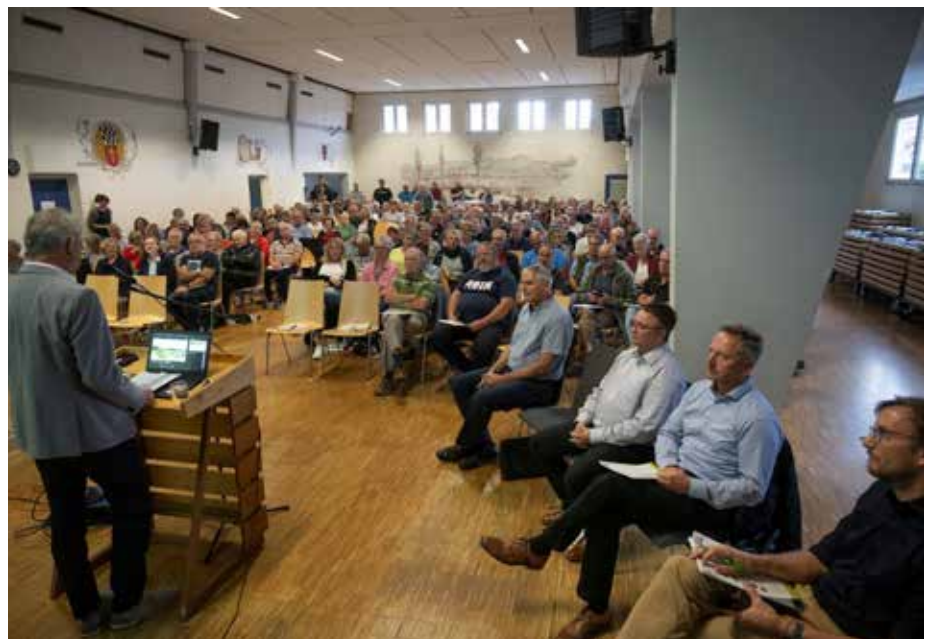
Die Idee einer nachhaltigen zentralen Nahwärmeversorgung hat bei den Bewohnern von Hügellheim großen Anklang gefunden.