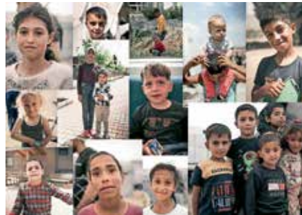
Collage erstellt von Mübeyra Erkuş

Stelle stellvertretend nur einige: Sparkasse Markgräflerland, Volksbank Breisgau-Markgräflerland, Firma Streck Freiburg, Familie Dörner und alle kleinen und großen Spenderrinnen und Spender! DANKE!