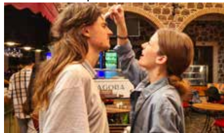
Vorbereitung für die Filmaufnahmen

In einigen Wochen ist Weihnachten – für viele Menschen Weihnachten in Krieg und Elend. Die Engel sprachen zu den Hirten: „Friede auf Erden den Menschen, die guten Willens sind.“ Wille bedeutet für das Projekt „Musik für den Frieden“, dass etwas getan werden muss, um Frieden zu erreichen. Frieden tritt nicht ein, wenn man auf dem Sofa sitzen bleibt und nörgelt. Jeder kann seinen Fähigkeiten und Möglichkeiten nach etwas für den Frieden tun. Dazu möchte „Musik für den Frieden“ inspirieren.