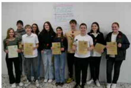
Die neu ausgebildeten StreitschlichterInnen an der ARS.

Mit instrumentalen und Gesangsbeiträgen zeigten die StreitschlichterInnen auch ihr musikalisches Können und gestalteten so den feierlichen Rahmen.