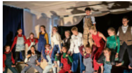
Auftritt Zirkus Ragazzi Basar Waldorfschule