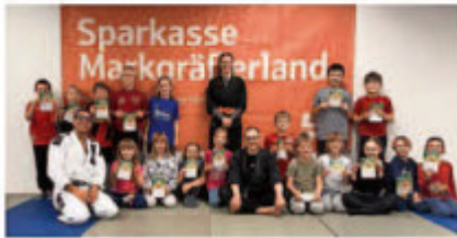
Selbstverteidigung für Grundschüler

Aufgeteilt in zwei Altersgruppen, 1.+2. Klassen und 3.+4. Klassen, wurde den über 50 Kindern in altersgerechter Theorie und Methodik nahegebracht, was sie selbst in verschiedensten Situationen tun können: Was mache ich, wenn mich jemand anspricht, wenn mich jemand anruft, den ich nicht kenne, wenn mir jemand etwas verspricht, wo hole ich Hilfe usw.