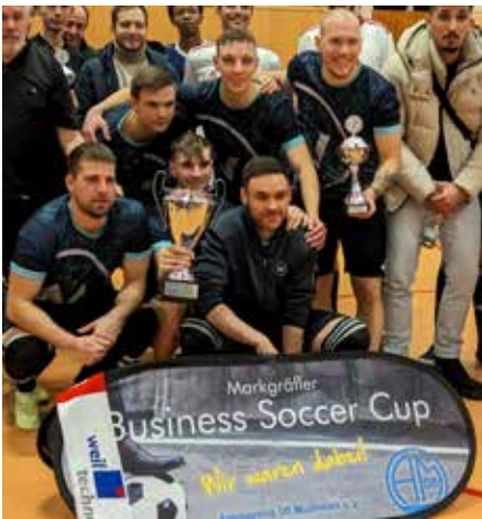
Das Siegerteam von Weil Technology

Herzlichen Glückwunsch den Gewinnern und Platzierten!