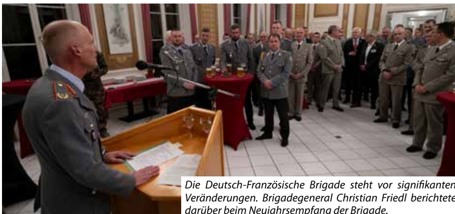
Die Deutsch-Französische Brigade steht vor signifikanten Veränderungen. Brigadegeneral Christian Friedl berichtete darüber beim Neujahrsempfang der Brigade.

Am Sonntag, den 09.06.2024, findet die Wahl zum Kreistag des Landkreises Breisgau-Hochschwarzwald statt. Nach der öffentlichen Bekanntmachung der Wahl auf der Homepage des Landratsamtes können nun bis zum 28.03.2024 um 18.00 Uhr die Wahlvorschläge für die Kreistagswahl schriftlich beim Vorsitzenden des Kreiswahlausschusses im Landratsamt eingereicht werden. In der Sitzung des Kreiswahlausschusses am 11.04.2024 wird über die Zulassung der eingegangenen Wahlvorschläge entschieden. Bei der Kreistagswahl sind im Landkreis Breisgau-Hochschwarzwald insgesamt sechzig Kreisräte für die nächsten fünf Jahre zu wählen. Dazu ist der Landkreis in insgesamt zehn Wahlkreise eingeteilt. Alle weiteren Einzelheiten zur Wahl finden sich in der Rubrik „Bekanntmachungen“ auf der Homepage des Landratsamtes unter www.lkbh.de .