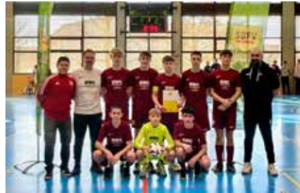
C-Junioren der SG Weilertal

Die besten 6 Mannschaften traten in 2 Gruppen gegeneinander an. Mit einem 2:2 gegen Sportfreunde Eintracht Freiburg II und einer knappen 0:1-Niederlage gegen Sportfreunde Eintracht Freiburg I war das Halbfinale gebucht.