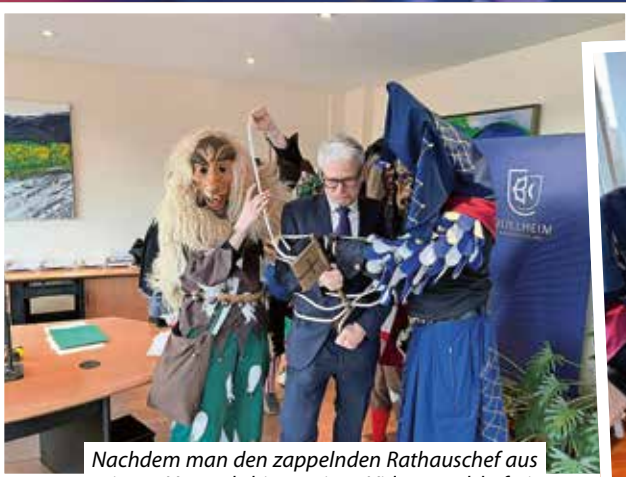
Nachdem man den zappelnden Rathauschef aus seinem Versteck hinter einer Videowand befreit hatte, wurde er unter großem Gejohle ins Foyer des Rathauses geschleppt.

Nach der offiziellen Zeremonie feierten Narren und Rathauspersonal gemeinsam im Foyer. Das Rathauspersonal hatte sich wieder einmal in phantasiereichen Kostümen gewandelt und trug zur ausgelassenen Stimmung bei.