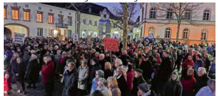
Markgräfler Platz und volle Demo

hat uns allen gezeigt, es ist 5 vor 12 und unsere Demokratie ist in Gefahr. Jetzt gilt es weiter den Rechtsextremismus in die Schranken zu weisen und zu zeigen, für deren Denken und Handeln ist in unserem Land kein Raum. Die Nichtwähler sollten zu Wahl gehen und die Protestwähler sollten sich gut überlegen, ob sie Parteien mit rechtsextremistischer Gesinnung ihre Stimmen geben.