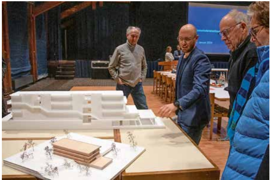
Die Erweiterung der MFW-Grundschule wird teurer als geplant, was im Gemeinderat für Diskussionen sorgte.

Das Raumprogramm des Wettbewerbs sah ursprünglich einen zusätzlichen Flächenbedarf für acht Klassenzimmer mit jeweils 65 Quadratmetern Fläche, vier Teilungsräume mit jeweils 32,5 Quadratmetern und den Ausbau einer Mensa vor. Die drei zusätzlichen Klassenräume, die bestehende Klassenräume direkt hinter der Aula ersetzen sollen, waren ursprünglich nicht Bestandteil des Auftrages. Hinzu kommen auch Arbeiten, die durch die mittlerweile geltenden höhe-