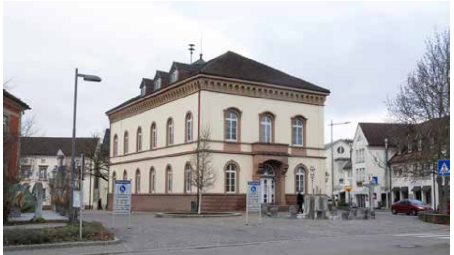
Der Gemeinderat befasste sich in seiner jüngsten Sitzung mit dem aktuellen Stand der Planungen zur Nachnutzung des Alten Rathauses.

Schuldezernent Michael Kaszubski erläuterte, dass die Musikschule dringend mehr Platz benötigt. Derzeit ist die Hortbetreuung neben dem Hauptgebäude des Schulzentrums I in einem alten Pavillon untergebracht, was einen erhöhten organisatorischen Aufwand bedeutet. Durch den Musikunterricht kommt es zudem zu Nutzungskonflikten, da die Hortkinder für ihre Hausaufgaben Ruhe benötigen. Erschwerend kommt hinzu, dass der Pavillon im Zuge der Bauarbeiten an der Michael-Friedrich-Wild-Grundschule abgerissen werden soll. Eine alternative Unterbringung der Hortgruppen ist derzeit nicht in Sicht. Die Leiterin der Musikschule, Miriam Rudolph,