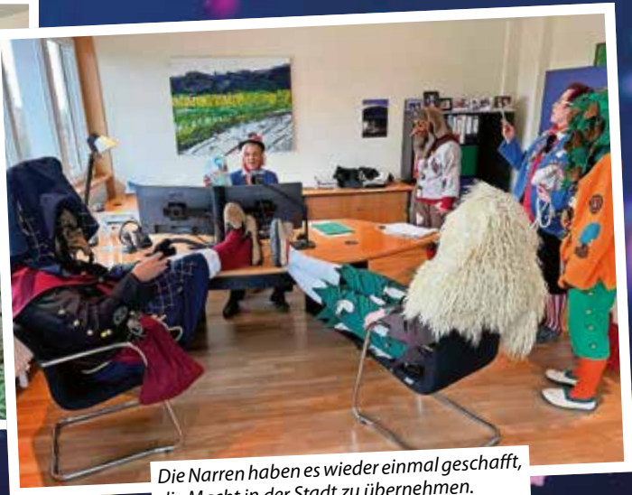
Die Narren haben es wieder einmal geschafft, die Macht in der Stadt zu übernehmen.