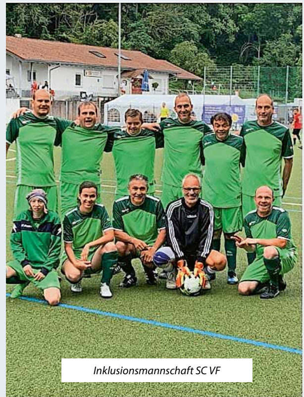
Inklusionsmannschaft SC VF

Die Inklusionsmannschaft des SC Vögisheim-Feldberg trainiert mittwochs um 19 Uhr. Wer mitmachen möchte, kann sich gerne per E-Mail ( info@scvoegisheim.de ) an uns wenden. Zudem möchte ich die Bevölkerung zu unserem Bezirkshallenturnier am 25.02.2024 in der Halle 1 in Müllheim einladen. Beginn ist um 10.30 Uhr.