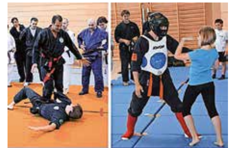
Selbstverteidigung in Müllheim 2016

Für weitere Informationen und zur Anmeldung können Sie sich an tammazla@gmx.de wenden.